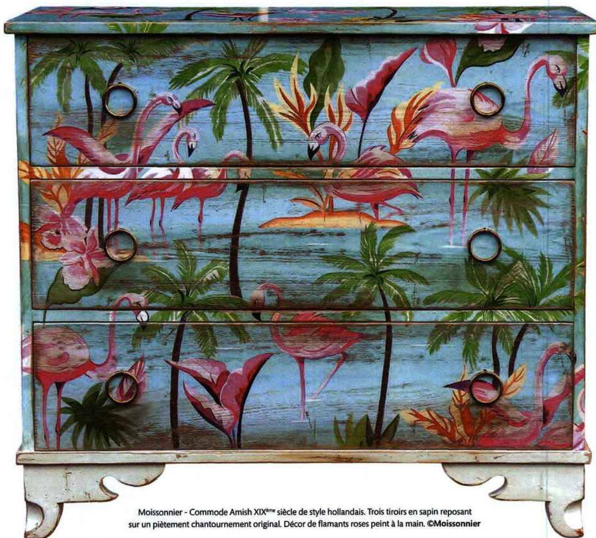
Moissonnier - Commode Amish XIX ème siècle de style hollandais. Trois tiroirs en sapin reposant sur un piètement chantournement original. Décor de flamants roses peint à la main.

En janvier dernier, Maison & Objet a donné le LA des tendances 2015. Sous la thématique MAKE, même le savoir-faire industriel se teinte d'une aura artisanale. Les matériaux, les finitions, l'éloquence des designers face à leurs créations. Une sensibilité, une transmission même de la fonction au service d'une envie de partage. C'est ça le sens du design.